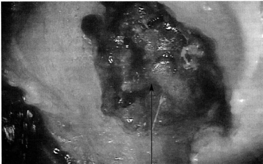
Abb. 1: Fettig degenerative Osteonekrose.

Bouquot untersuchte 224 Gewebeproben von Unterkieferalveolarknochen, die er bei 135 Patienten mit Trigeminusneuralgie oder atypischen Gesichtsneuralgien entnehmen konnte. Alle Proben zeigten das deutliche Vor-